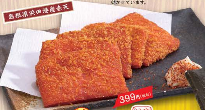
島根県 浜田産赤天 定番 399円(税別) ~名物ピリ辛さつま揚げ~ 魚肉のすり身に赤唐辛子を練り 込んだ赤天。熱々揚げたて! ビールとの相性 バッチリです!