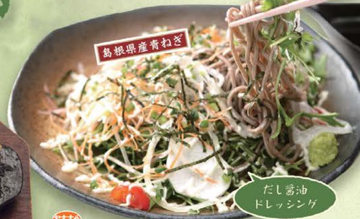
定番 599円(税別) 緑結び出雲そばサラダ 599円(税別) 緑結びの圓、出雲のそばをノンオイルドレッシングのヘルシーなサラダ仕立てに。