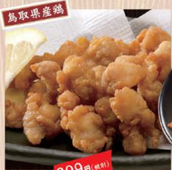
とつ鶏 なんこつ唐揚げ 399円(税別) 定番! コラーゲンたっぷり!! 鳥取県産 鶏ひざなんこつを使用!!