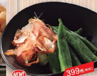
NEW! オクラわさび 399円(税別) オクラのネバネバ成分のムチンは 胃の粘膜を保護してくれます。 わさび特有の辛みをほど良く 効かせています。