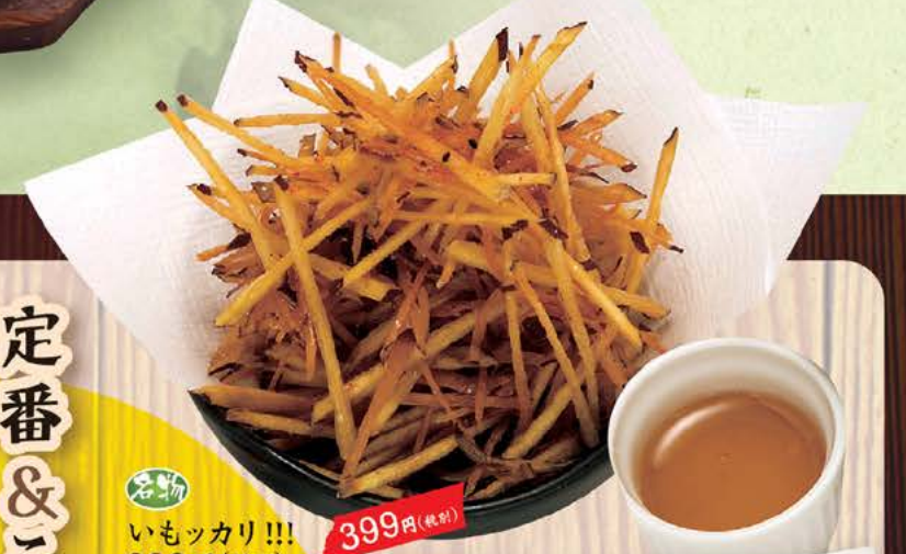
定番 399円(税別) いもツカリ!!! 399円(税別) 食物繊維豊富なさつまいもを1本細切りにし、 カリッと揚げました。そのまま でもよし、はちみつを付け ても更によし。