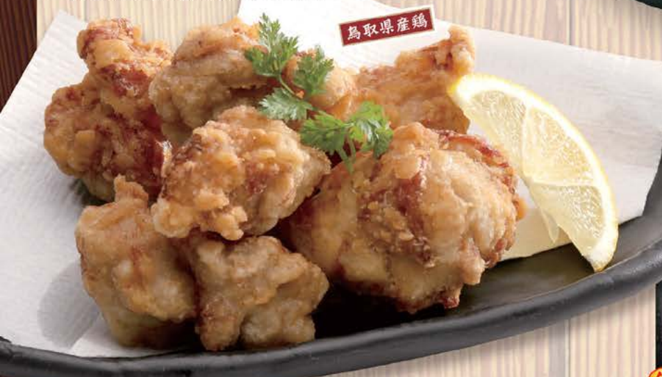
とつ鶏唐揚げ 699円(税別) とつ鶏の食材にこだわったその名もとつ鶏唐揚げ!! サクサクジューシー!