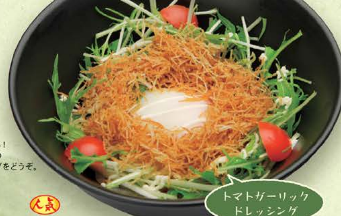
定番 599円(税別) カリカリポテトと 水菜のえんやサラダ 599円(税別) カリカリに揚げたじゃが芋にとろ〜り温泉玉子、シャキシャキの水菜と いるんな食感が楽しめます。