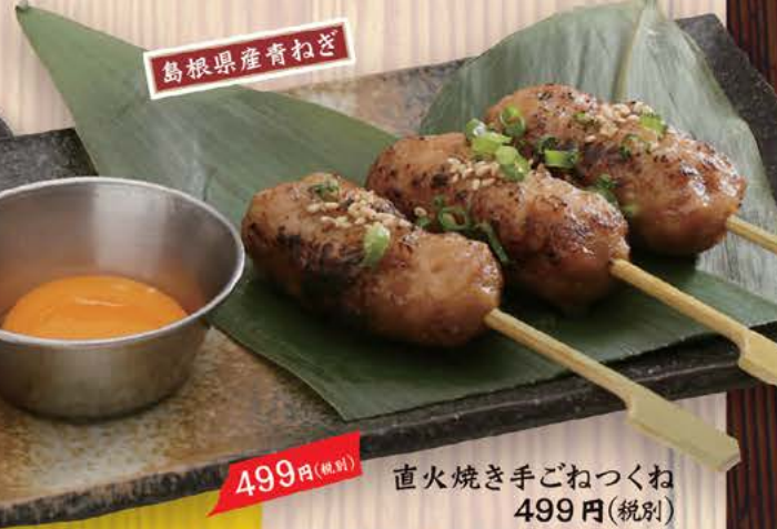
島根県 産青ねぎ 定番 499円(税別) 直火焼き手ごねつくね 499円(税別) ふんわりとして口でほどける食感と鶏の旨味とコクが楽しめる 焼きつくね串です。