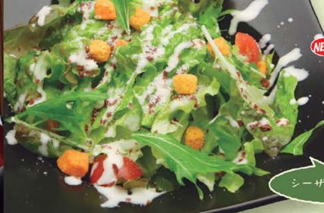
NEW! シーザーサラダ レギュラーサイズ 599円(税別) ハーフサイズ 399円(税別) 399円(税別) まずはこれから! チーズ風味の 定番サラダをどうぞ。