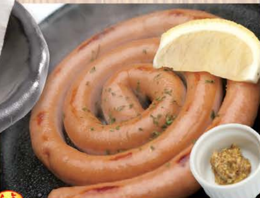
定番 699円(税別) ウィンナーうずまき君! 699円(税別) ビールとの相性は抜群です!