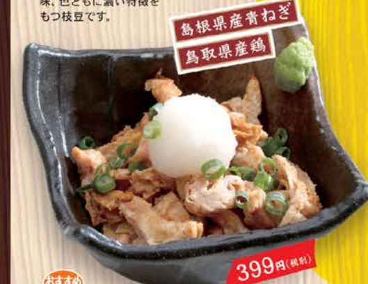
定番 399円(税別) 炙りとつ鶏皮ポン酢 399円(税別) 新鮮な鶏皮を一度オーブンで焼き、更に茹でて余分な脂を落とし、 旨みをギュッと凝縮します。柚子胡椒と一緒にさっぱりビリりとどうぞ。