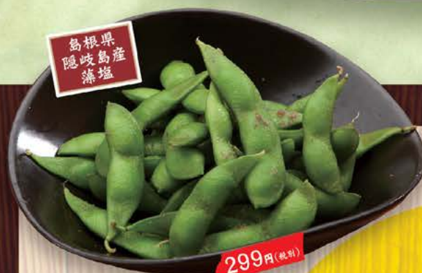
島根県 隠岐の藻塩 定番 299円(税別) 濃味えだまめ隠岐の藻塩で 299円(税別) 茶豆を掛け合わせて作られた品種で、 味、色ともに濃い特徴を もつ枝豆です。