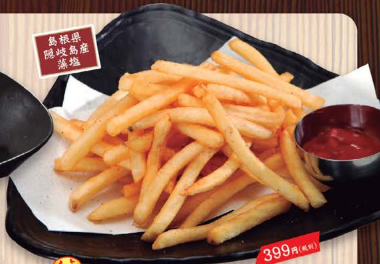
島根県 隠岐の藻塩 定番!! ポテトフライ隠岐の藻塩で 399円(税別) カリッと揚げたポテトにミネラルをたっぷり含んだ藻塩で仕上げます。